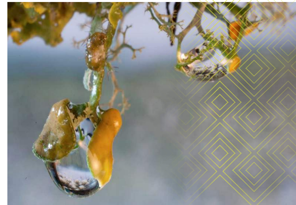
© Fundación Arts Collegium. Por los caminos del agua. 2014

El segundo tema son los conflictos entorno a lo ambiental: desde la segunda mitad del siglo XX el tema ha evolucionado desde las reivindicaciones por el uso del suelo y el habitar el espacio, pasando por la contaminación de las curtiembres en la zona de San Benito y las inundaciones en la cuenca media, llegando a inicios del siglo XXI cuando los temas que marcan la agenda social y política, son el efecto de la minería a cielo abierto, la recuperación de los humedales y la defensa del territorio.